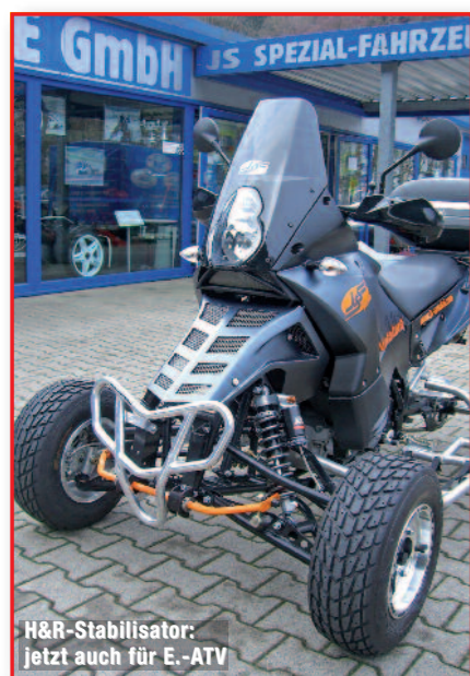
H&R-Stabilisator: jetzt auch für E.-ATV