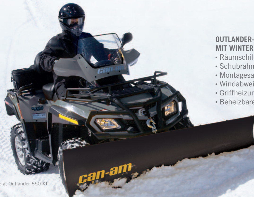
Abbildung zeigt Outlander 650 XT.