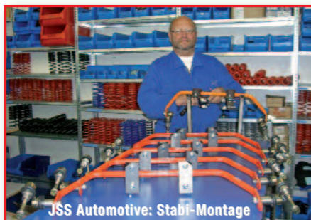
JSS Automotive: Stabi-Montage

Die Montage ist durch den vormontiert gelieferten Kit eine Sache von rund 30 Minuten. Spezialwerkzeug oder besondere Kenntnisse sind nicht erforderlich. Wie bei allen Produkten von JSS / H&R selbstverständlich, liegt für die Eintragung in die Fahrzeugpapiere ein fahrzeugbezogenes Teilegutachten vom TÜV bei. Eine aktuelle Liste der verschiedenen Quads und ATVs, für welche der Stabilisator lieferbar, befindet sich auf der Homepage von JSS Automotive. X